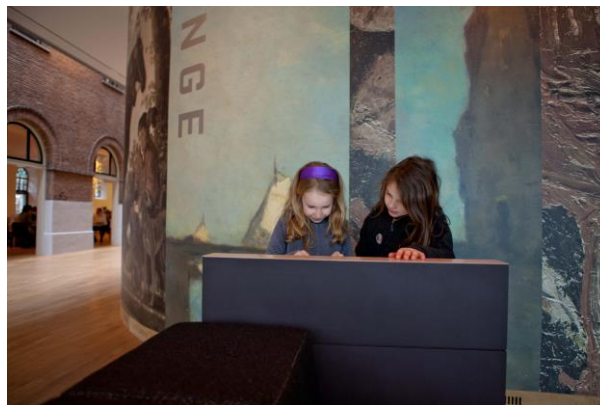
Kinderen in de lounge van het museum

Waar mogelijk worden daarbij onderwerpen gebruikt die samenhangen met die uit andere leergebieden. Het onderwijs wordt daardoor meer samenhangend en mede daardoor betekenisvoller voor leerlingen. Maar voorop staat natuurlijk de authentieke bijdrage van kunstzinnige oriëntatie aan de ontwikkeling van kinderen.