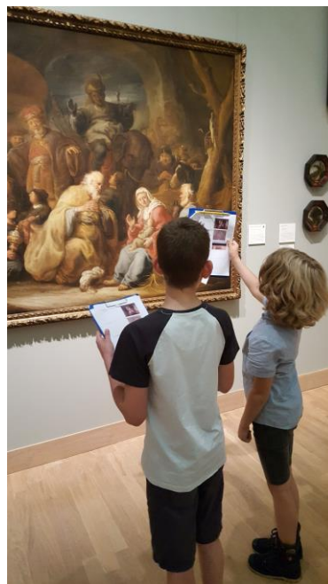
Kinderen tijdens een rondleiding