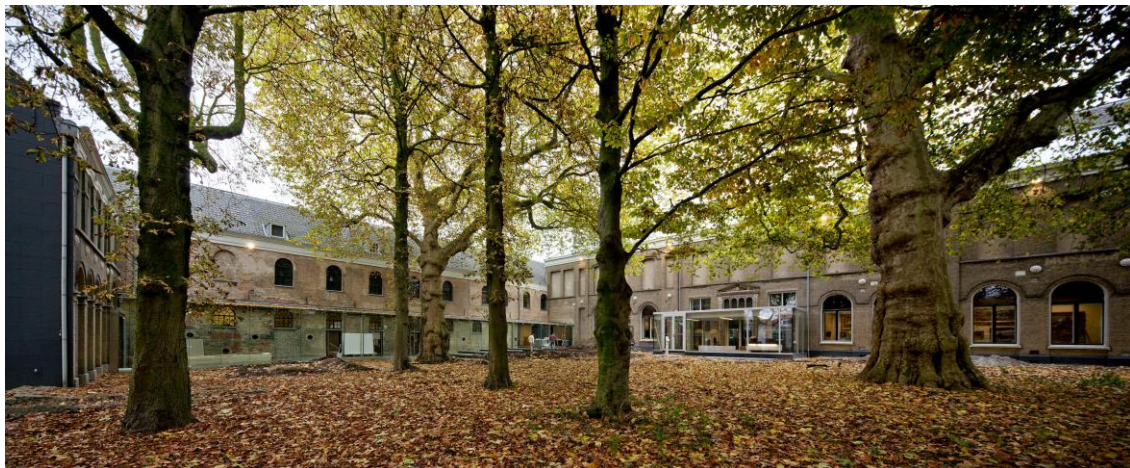
Dordrechts Museum, foto vanuit de tuin